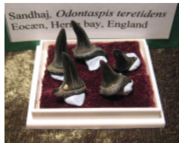
Herne Bay: gråsorte