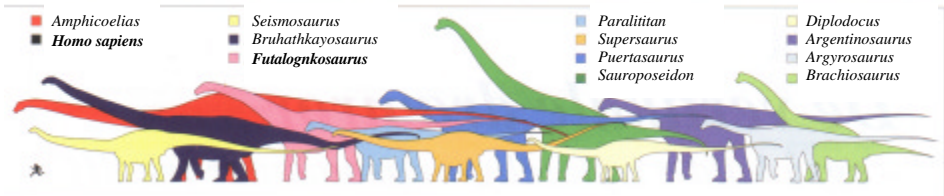
Anslået udformning og størrelse af de største kendte sauropoder sammenlignet med et 180 cm højt menneske (Grafik : forfatteren)

Til sammenligning levede de største nordamerikanske sauropoder som fx brachiosauriden Sauroposeidon proteles (34 m lang, 17-18 m høj) og diplodociderne Seismosaurus hallorum (33 m lang) og Supersaurus vivianae (32-33 m lang) i det sene Jura og tidlige Kridt, altså i tiden op til titanosaurernes indtog. På længde og højde kunne de nordamerikanske megadinosaurer måle sig med de yngre sydamerikanske titanosaurer, mens sidstnævntes vægt var væsentligt højere grundet en kraftigere kropsbygning.