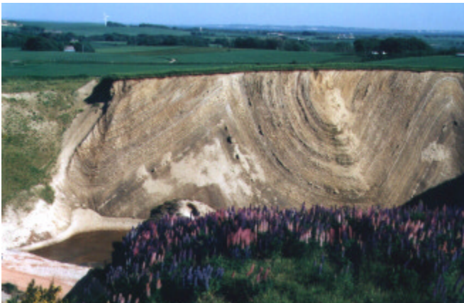
I Skarrehage graven ved museet ses foldning af moleret helt enestående - graven er 25 meter dyb.

Landskabet i hele Limfjordsområdet er først formet under istiden og dernæst kultiveret af menneskene. De sidste istiders kilometertykke iscappe havde flere fremskud. Den foldede og pressede de frosne molerlag op i de fantastiske former, som kan ses ved klinerne på nordkysten af Mors. Den sidste istid sluttede her i området for 15.000 år siden og efterlod sig mange spor i landskabet som f.eks. det kupe-rede terræn og Limfjordens udformning.