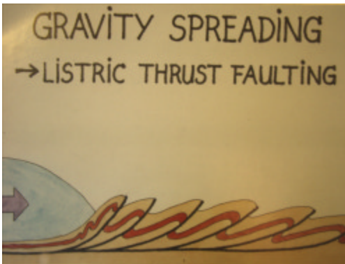
Isens oppresning af molerlagene tilblivelse