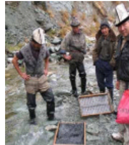
Småskala minedrift i Kirgisistan

Småskala minedrift har mange plusser, men der er også flere minusser.