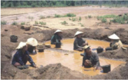
Småskala minedrift i Laos

11. Peter Appel: Småskala minedrift - Eneste overlevelsesmulighed for mere end 100 millioner mennesker. Småskala minedrift er i princippet tre mand og en trillebør. Det vil sige minedrift udført uden tekniske hjælpemidler af mennesker uden eller med kun ringe teknisk baggrund. På globalt plan er mere end 100 millioner mennesker afhængige af småskala minedrift.