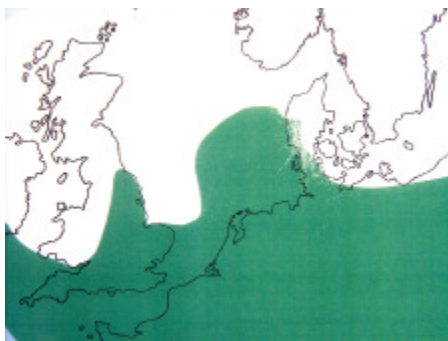
Isens udbredelse under sidste istid

Det er næsten ikke til at forstå, hvordan sådan en stor skive af undergrundslagene blev forskudt op, som vi ser det på Hanklit. Men det er jo også vanskeligt at forestille sig hele Vendsyssel overskredet af en indlandsis – måske op imod 1000 m tyk. Selve mekanismen, hvorved oppresningen foregår, er illustreret på næste side. På dansk kalder vi det for isvægts teorien (på engelsk gravity spreading) hvorved vi forstår, at en iskappe skrider fremad og med sin vægt der trykker nedad. Herved opstår der en serie skeformede (listric) sprækkezoner, langs hvilke opskydningen foregår. Jo længere væk vi befinder os fra fronten af isen, des fladere og mere sammenhængende er skiven, svarende til Hanklit strukturen.