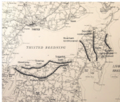
Opholdslinier i landskabet på Mors

Den sidste istid i Danmark kaldes Weichsel-istiden. Da den sluttede helt for ca. 10.000 år siden, havde den været omkring 50.000 år. I løbet af de 50.000 år var der både varme og kolde perioder. Derfor rummer det danske landskaber mange og tydelige spor efter isens skiftende fremstød og tilbagetrækninger. Det mest berømte