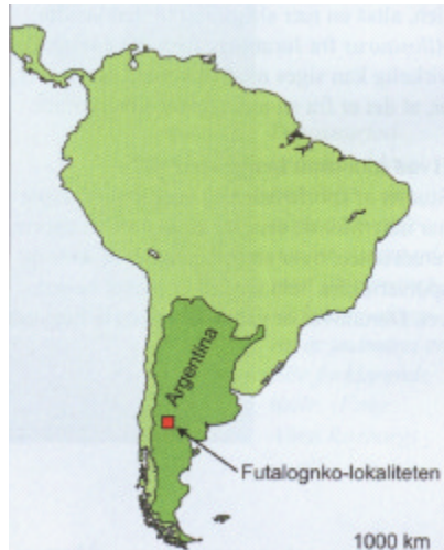
Futalognko-lokalitetens placering i Argentina. (Grafik: forfatteren)

Futalognkosaurus dukei tilhører titanosaurerne, en gruppe af solidt byggede sauropo-