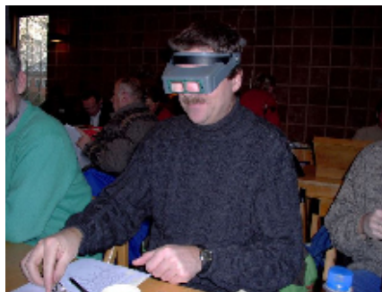
Bo ville i hvert fald være sikker på, at han så rigtigt !