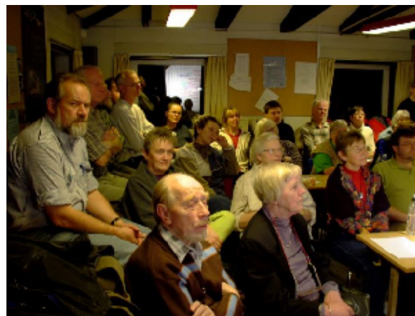
Og mange tilhørere