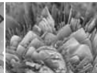
Ellingsenite SEM. 16.04. 2009