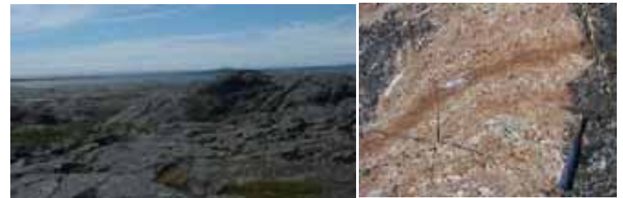
Nuvvuagittuq-bæltet i Quebec i Canada.