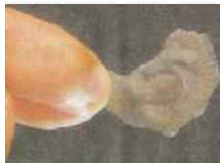
Et af de fossiler, der blev fundet ved et stenbrud i det afrikanske land Gabon. Billedet er frigivet af det franske videnskabelige institut CNRS.

BETALINGSSERVICE - det nemmeste i verden