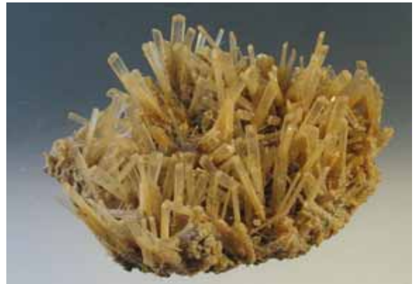
Gipskrystaller fra Lubin Polen.

Omtalen af megastore gipskrystaller i Lapidomanen 2009:3 stod pludselig i frisk erindring, da IUC: Crystallography in Spain, 2010:3 skrev om gipsens historie. Jeg forsøgte at supplere med oplysninger om mørtel, men hvor blev jeg skuffet! Mørtel til Den Kinesiske Mur hævdes et sted at være ris og jord. Mesopotamien havde noget, der lignede mørtel og nogle steder er der fundet gips i husene, men der blev ikke skelnet mellem kalk- og gipsmørtel. Der blev formentlig brugt jord med kalk i uden nærmere kendskab til de fysiske egenskaber. Den britiske murer Joseph Aspdin (1778-1855) opdagede og (patenterede cement) i 1824, at 75 dele kridt og 25 dele jord ved opvarmning til 1450-1600 grader gav et hårdt kalksilikat: klinker. Klinker males til pulver og binder med oprørt vand hårdt kalkhydro-silikat og aluminat. Aspdin og Edv. Fewer, Irland oprettede den første Portland-cementfabrik i Lägerdorf 1862. Joseph Monier (1823-1906) opfandt armeringsjern, hvor stål og cement forbindes. Cementproduktion frigiver ca 5 % af Jordens udledning af kuldioxid.