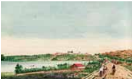
Vejen til Lagoa Santa malet af Brandt. Kirken ligger midt i billedet og Lunds hus til højre for den ved vejen.