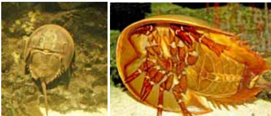
Billede 3. Dolikhale set ovenfra og nedefra.

Ved de store tilfælde af massedød er der argumenteret for såvel calciummangel som forsurening af havet. Trilobitterne som art imødegik calciumsvind ved at blive mindre, men ved forsurening går hudskelettet lettere i opløsning, det gør øjnernes linser af calcit også. Bliver trilobitterne mindre, bliver øjnene det også, og det øger opløsningshastigheden af øjets linser. Hvis havet desuden blev koldere, øgedes trilobitternes problemer på grund af calcit's øgede opløselighed ved lavere temperaturer. En passende balance mellem størrelse på hudskelet og øjne lykke-