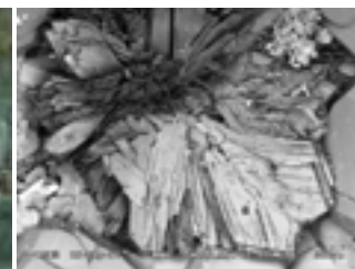
Ellingsenite SEM. 2007