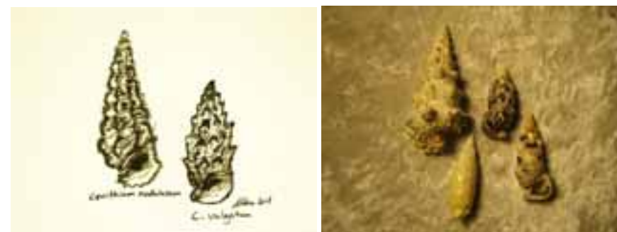
Skitsen viser to forskellige recente arter.

Metacerithium hauniense , Lellinge grønsand