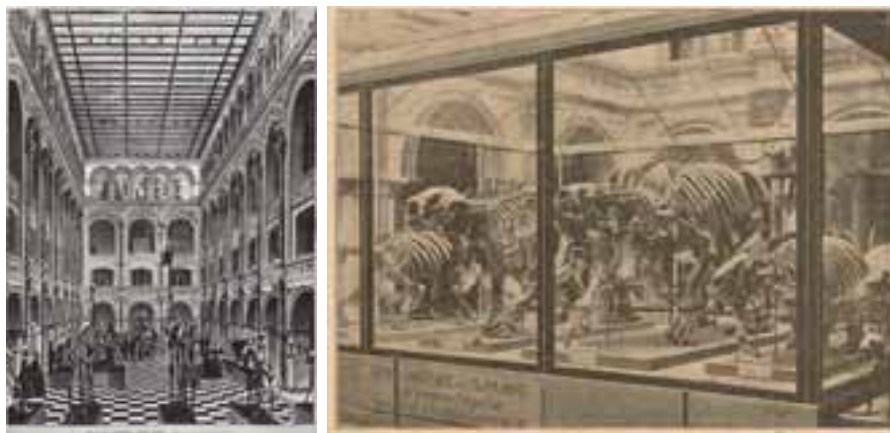
Den centrale hal i Krystalgademuseet, som den tog sig ud de første år efter 1870

I 1960 flyttede zoologisk museum fra bygningen i Krystalgade. Opført 1863-69, tegnet af arkitekten Christian Hansen, som også tegnede det tidl. Kommunehospital og Den Kongelige Mønt. I mindre format var det som datidens andre stolte palæer over naturhistorien.