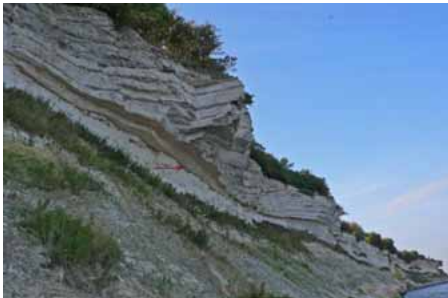
Billede 5. Stevns Klint. Fiskelerlaget markeret med en rød pil.

Hvis calciumhypotesen er sand, er det plausibelt, at især planteædende dinosaurer først fik problemer med overlevelse ved knaphed på kalk, rovdinosaurer får jo også tilført kalk ved at fortære andre arter med kalkskeletter.