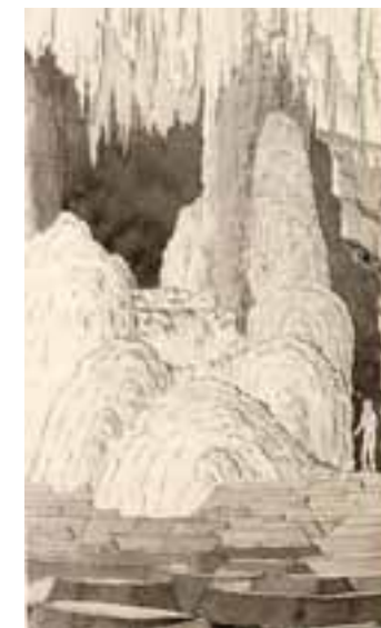
Brandts vision af en af de mest imponerende formationer i Maquiné-hulen, det såkaldte "Feeslot".

Det var dog tilstedeværelsen af de mange fossile dyre-knogler såvel over den røde salpeterholdige