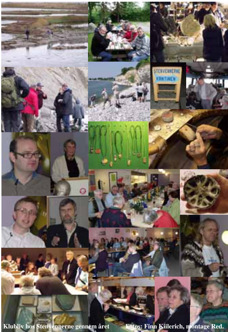
Klubliv hos Stenvennerne gennem året