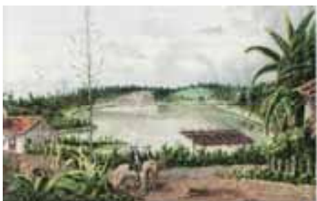
Denne fine gouache malede Brandt som illustration til Lunds artikel om menneskefundene i Sumidouro. Hulen ligger i klippeskrænten bag søen.

I 10 år rejste Lund fra hule til hule sammen med et større eller mindre hold af medhjælpere. Et ufatteligt arbejde under primitive forhold, hvor der blev hakket, transporteret, rubriceret og katalogiseret tusindvis af knogler. 1840 blev et epokegørende år med fundet af de første mennesker i Sumidouro-hulen. Lund skriver: