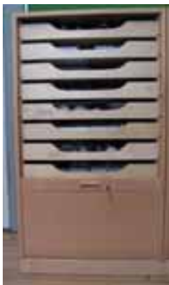
foto af skabet.